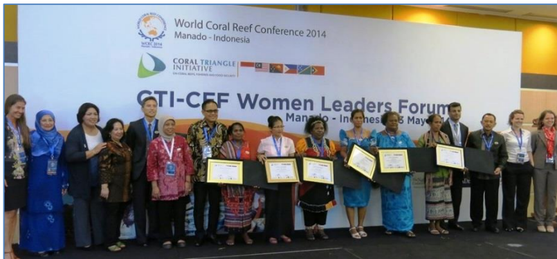
WLF 設立における CT 各国の受賞者 - インドネシアマナド、2014 年 5 月