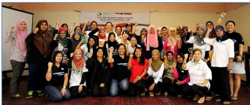
マレーシアでの WLF イベント - サバ州クダッ町、2015 年 3 月